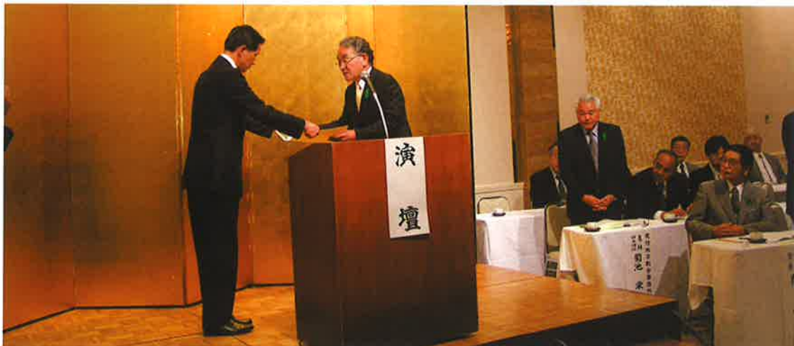
会長感謝状を受ける林県農林振興公社参与