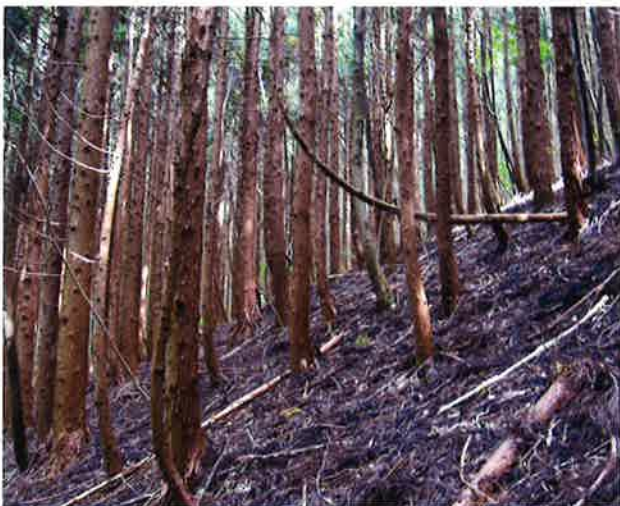
緊急に間伐が必要な森林

このため、これらの機能を十分に発揮できる状態で次の世代に引き継いでいく必要があることから、本年4月から森林湖沼環境税を導入し、(1)「適正な森林整備の推進」、(2)「木づかい運動の推進」、(3)「県民協働の森林づくりの推進」を施策の3つの柱として、森林の保全・整備を進めていくこととしています。