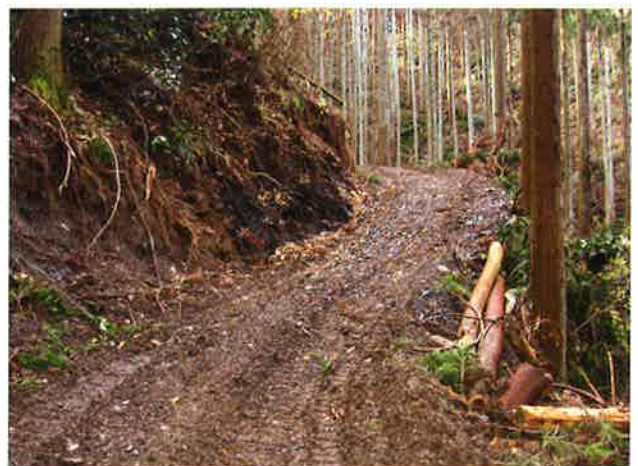
開設された作業道