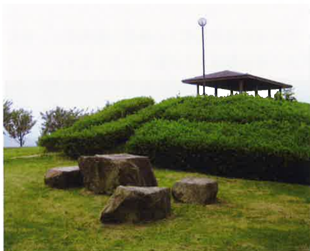
富谷山ふれあい公園の四阿

また、豊かな村づくり事業で整備された「富谷山ふれあい公園」や平成9年度にふるさと林道事業で整備された「久原・富谷線」は、桜川市の野外レクリエーションとして重要な地区となりうる可能性が高い地域です。