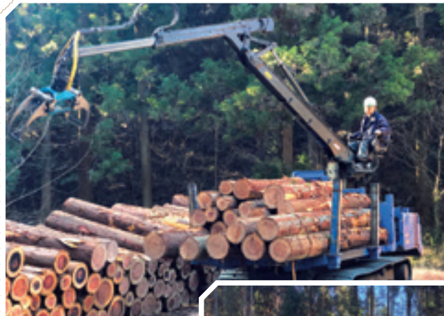
フォワーダによる 運搬搬出作業

幅広い年代の作業員と共に、レクリエーションや懇親会等を含め信頼関係と、元気で活力のある森林組合を構築してまいります。「地域のために」を目指して。