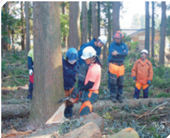
緑の雇用研修指導